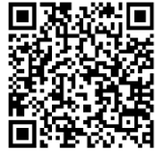
申込みQRコード (Google Forms)